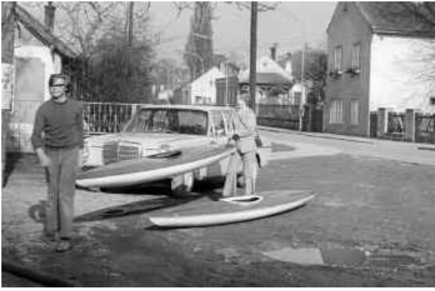
Eichwalder, der bereits 1974 ein Kajak besaß und schon einschlägige